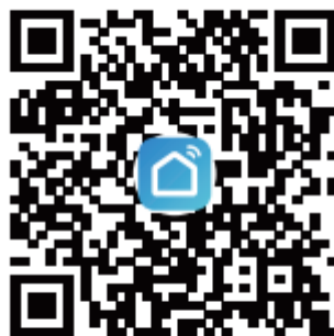
Smart Life App